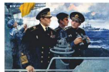
Главнокомандующий ВМФ адмирал В.Н. Чернавин на учениях

мундира. Две картины дают к ней иллюстрацию.