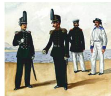
Обер-офицер Ластовой полуроты, офицер артиллерии и матросы Гвардейского экипажа. 1858-1860 гг.

Но чтобы приобщиться к истории Военно-Морского Флота, не обязательно откладывать посещение музея на последние числа месяца. Здесь помимо постоянной экспозиции открыто несколько выставок. Одна из них — об истории морского