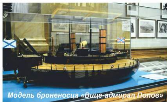
Модель броненосца «Вице-адмирал Попов»

Следующий зал посвящен участию моряков Черноморского флота в революции 1905-1907 гг., в