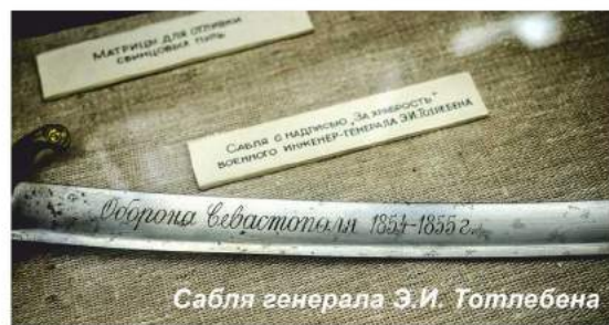
Сабля генерала Э.И. Тотлебена

С 1895 года музей размещается в специально построенном для него в центре города здании, которое и сегодня является одним из красивейших в Севастополе. В нем восемь залов. По каталогу 1913 года в музее насчитывалось свыше двух тысяч экспонатов, в середине 2000-х годов – свыше 30 тысяч экспонатов.