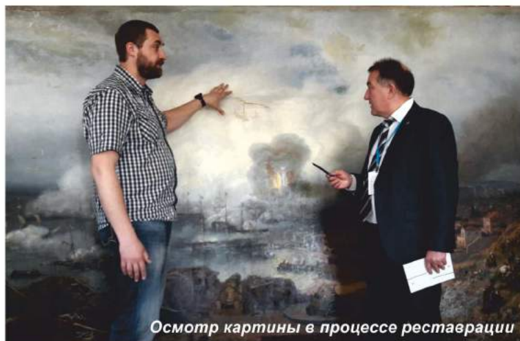
Осмотр картины в процессе реставрации