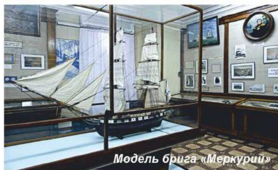
Модель брига «Меркурий»

Участие моряков-черноморцев в отражении иностранной интервенции в 1918-1922 годах, борьбе за установление Советской власти на юге страны, Гражданской войне посвящены материалы, собранные в зале № 5. Здесь можно увидеть модель крейсера «Аврора», тексты первых декретов Советской власти о мире и земле, карту-схему затопления кораблей Черноморского флота, модель эсминца «Керчь», детали с поднятых кораблей. В зале есть материалы и о русском морском зарубежье. Экспозиция зала рассказывает о восстановлении и строительстве советского флота в период с 1922 по 1941 год.