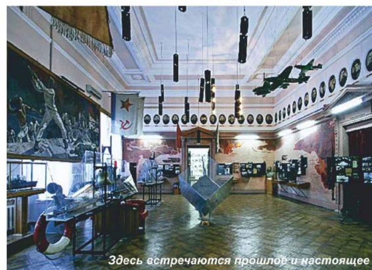
Здесь встречаются прошлое и настоящее

Более полувека с 1869 по 1917 год музей Севастопольской обороны собирал, хранил, экспонировал все, что было связано с Крымской войной 1853–1856 годов. В годы, последовавшие после Октябрьской революции 1917 г. и Гражданской войны, музею пришлось пережить не самые лучшие времена, а в 1925 г. его закрыли для посещения с формулировкой — «не отвечает требованиям музейного дела». В 1926 г. му-